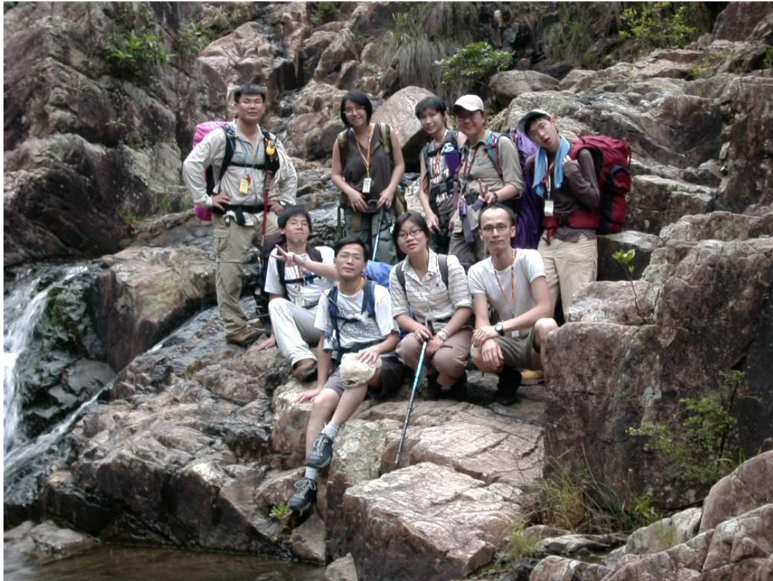
西沙十一號-----我最深刻的印象